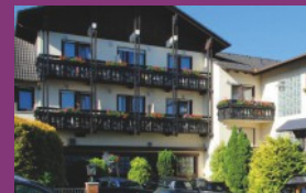
Hotel Schlößmann ***

Das 3 Sterne Hotel liegt in einer beruhigten Seitenstraße, umgeben von herrlicher Ruhe direkt im Gesundheitsviertel von Bad König.