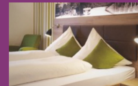
Gasthof Zur Krone

Herzlich willkommen im 3*** Superior Hotel im Herzen des Odenwalds, direkt gegenüber der Therme und in unmittelbarer Nähe des wunderschönen Kurparks.